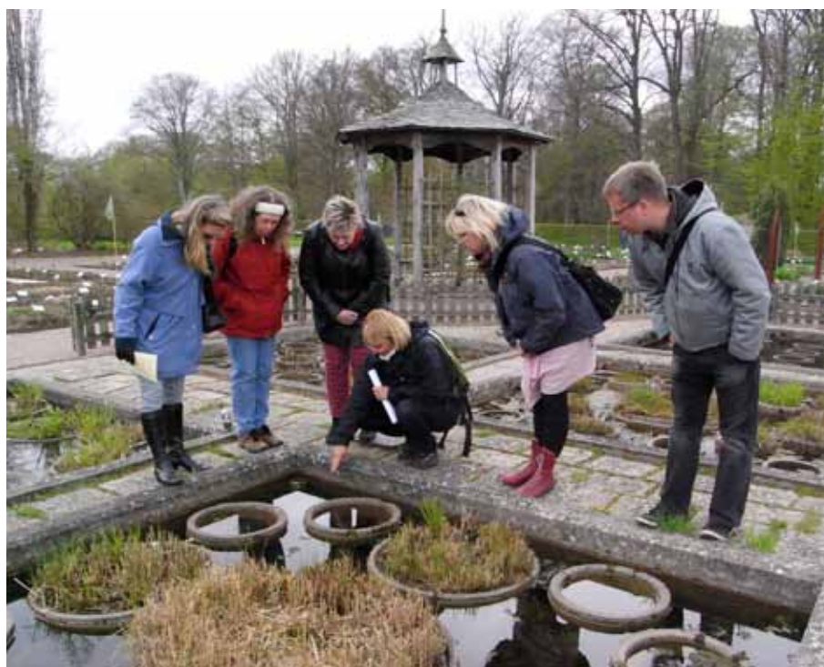
Skoletjenesten på Teknisk Museum och Helsingør-lärare på besök på Fredriksdals museer och trädgårdar.

Detta projekt med speciellt anpassade skolprogram var initierat av ett dansk-svenskt skolprojekt på Thorvaldsens Museum, som visade att språket spelade större roll än vi först trott. Det var dock få skolor som nappade på erbjudandet och genom olika kontakter förstärktes vår uppfattning att resekostnaderna var ett alltför stort hinder .