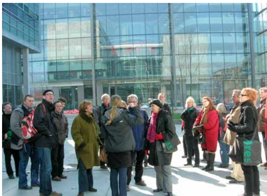
Lärarfortbildning i Ørestad om arkitektur och stadsplanering.

Under de första tre åren hade vi succé med våra fortbildningsdagar för lärare. Det var en strategisk tanke från början: att visa lärarna vad Öresundsregionens kulturinstitutioner kunde erbjuda skolorna, och i samband med det synliggöra vårt uppdrag. Vår intention var att de sen skulle komma tillbaka med sina elever, vilket de inte gjorde.