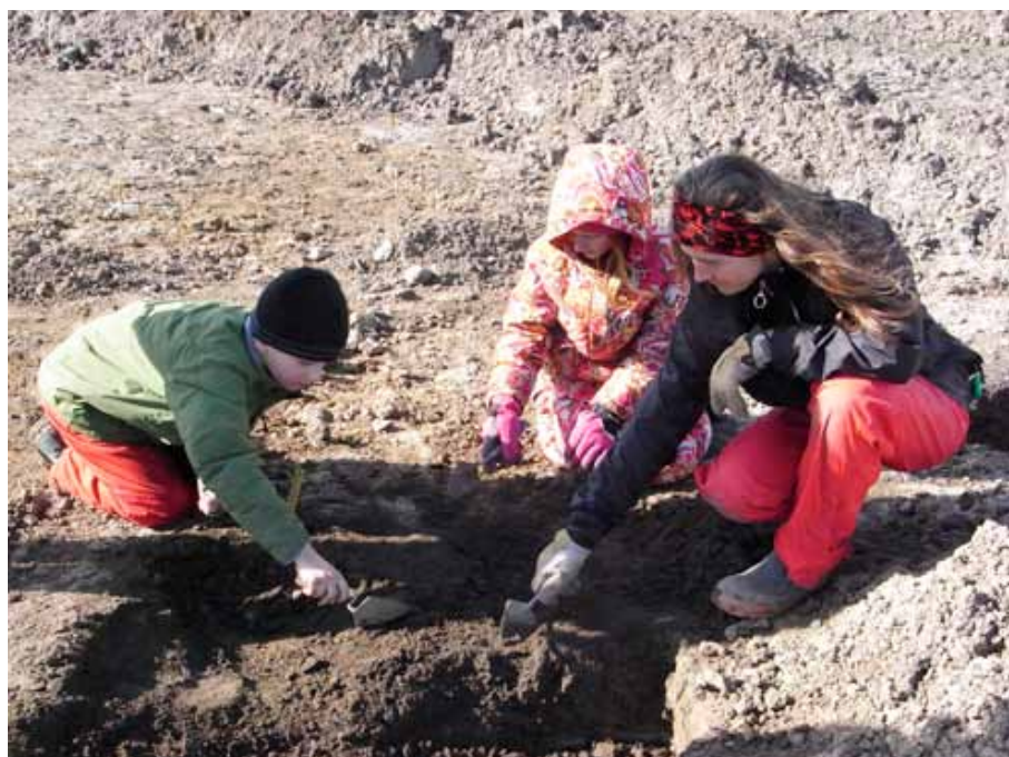
Arkeologisk utgrävning i Trelleborg.