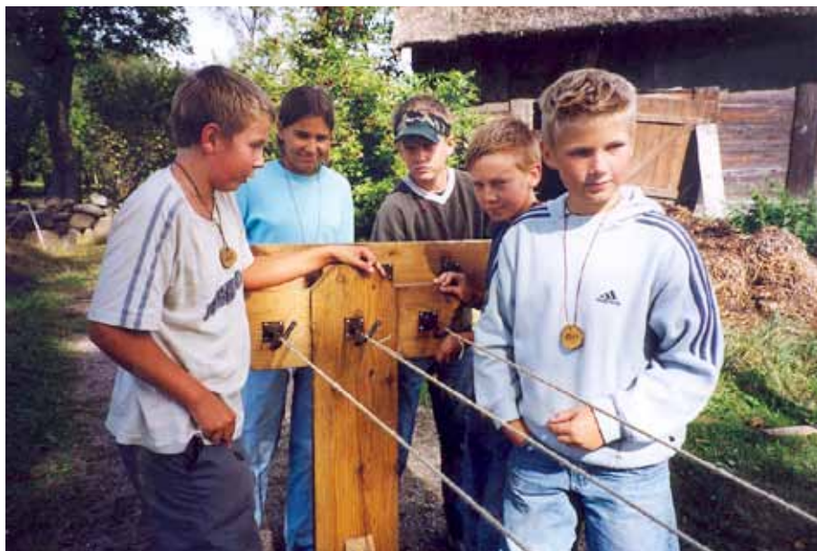
Lägerskola på Fredriksdals museer och trädgårdar 2003.

2003 års lägerskola bekräftade också denna tanke. Vi arrangerade den med Fredriksdals museer och trädgårdar i Helsingborg med två klasser i årskurs 5. I utvärderingen framkom det tydligt att båda klasserna såg dagen på Fredriksdal som lägerskolans höjdpunkt. Den pedagogiska personalen på Fredriksdal fick förstärkning av en kollega från Frilandsmuseet i Lyngby, vilket uppskattades både av personal och av elever. Det var en erfarenhet från lägerskolorna på Ven, där vi upptäckte hur viktigt det var för eleverna med en språklig balans i förmedlingen. Den klass som var på hemmaplan hade det mycket lättare, vilket den gästande klassen naturligtvis märkte och reagerade emot.