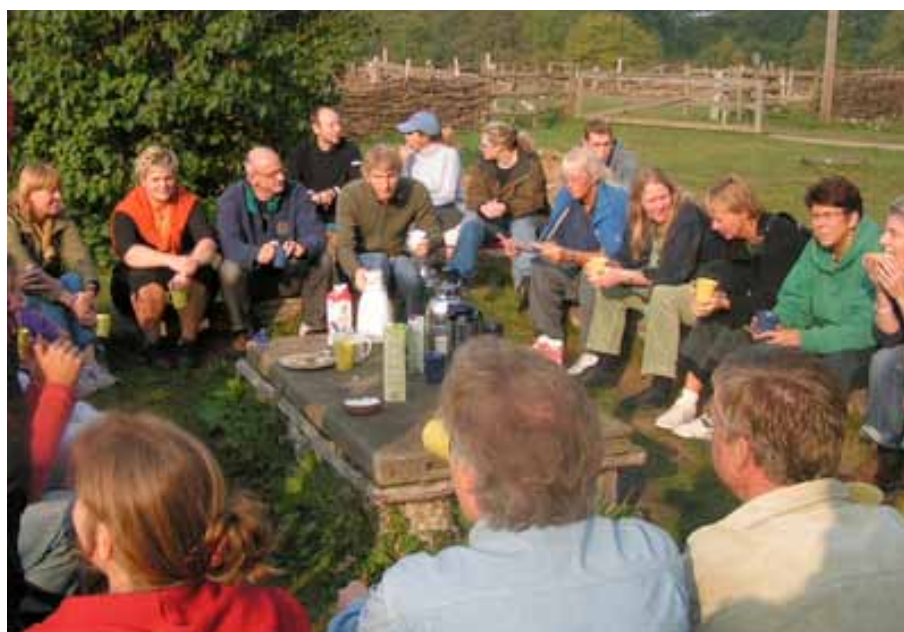
ÖKA-seminarium på Hörjelgården.

De största hindren är tid och pengar, om man vill bedriva undervisning och samarbete tvärs över sundet. Tid utifrån aspekten att skolor på båda sidor av Öresund styrs av olika skol- och läroplaner och att alla skolor/arbetslag måste planera allt längre i förväg. För att lyckas med ett samarbete krävs utrymme och flexibilitet i skolans läsårsplanering.