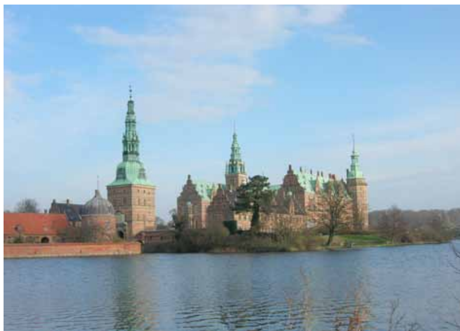
Mitt i historien – lärarfortbildning på Frederiksborgs Slot.

Under 2008 uppmärksammades det både i Sverige och i Danmark att det gått 350 år sedan freden i Roskilde . Vi producerade då två fortbildningsdagar kring temat historiesyn och utgav ett texthäfte, med artiklar av kollegor från några institutioner. Detta tema var mest intressant för svenska lärare. Under årens lopp har vi kunnat se att vissa ämnen var mer intressanta för den svenska eller danska sidan, medan andra (temat Kroppens språk samt arkitektur t ex) hade samma positiva gensvar på båda sidor av sundet. En anpassning till gällande läroplaner är nödvändig men räcker inte alltid. Det handlar också om behov av fortbildning för lärare (arkitektur) eller möjligheter att utvidga den enskilda ämnesundervisningen till ett projekt.