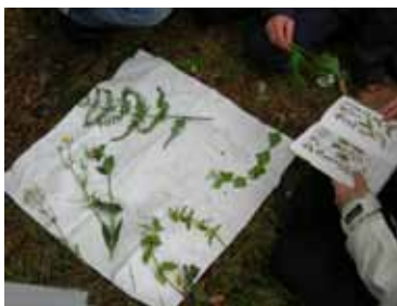
Lärarfortbildning på Fredriksdals museer och trädgårdar.