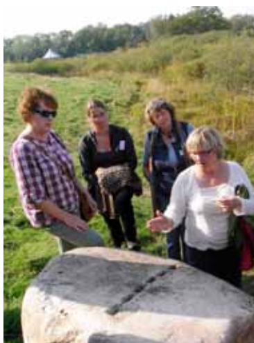
Lärofortbildning i Sagnlandet Lejre 2010.