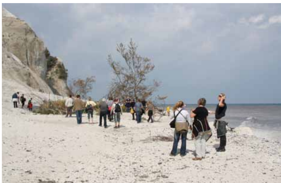
Skoletjenesten på studiebesök på Geocenter Møns Klint.