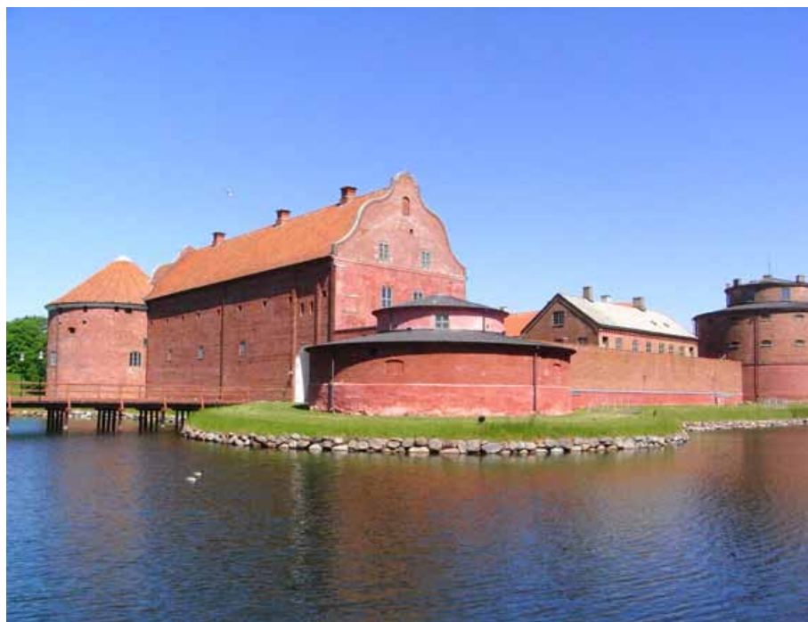
Citadellet i Landskrona byggdes under renässansen.

En ny strategi togs fram där vi beslöt oss för att mer aktivt samverka med andra pågående projekt och teman, där kollegor och/eller målgrupp (skolan) redan var involverade.