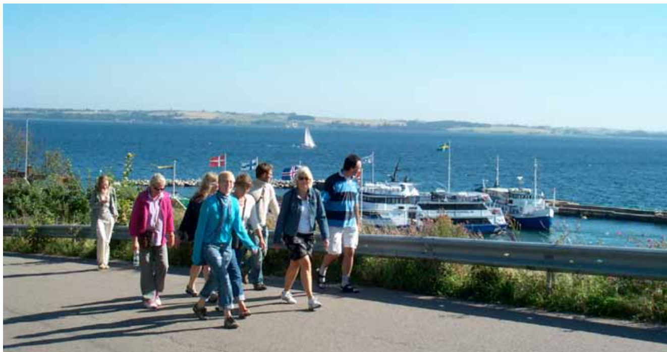
ÖKA-deltagare på väg till startseminarium på Ven.

ÖKAs syfte var att utveckla och genomföra en gränsöverskridande kompetensutveckling för kulturpedagoger och lärare i Öresundsregionen. Projektet bestod av två delar; en seminarierie och en webbplats, och undersökte hur man kunde använda kulturinstitutionerna i undervisningen och hur man kunde samarbeta på tvärs. Med samarbete på tvärs har här menats samarbete och erfarenhetsutbyte inom varje yrkesgrupp tvärs över Öresund och mellan yrkesgrupperna (kulturpedagoger/lärare).