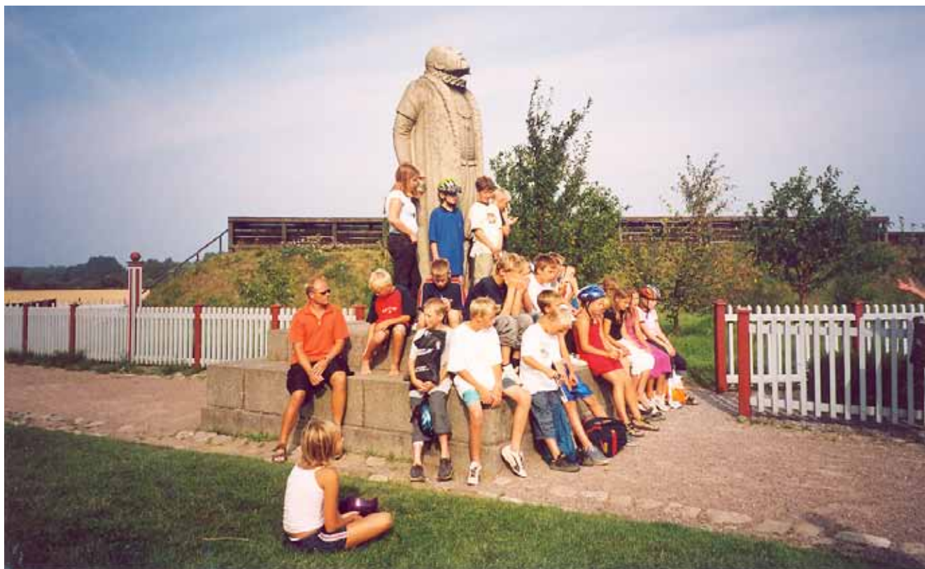
Lägerskola på Ven 2002.

Vi hade vid projektets avslutande fokus inställt på att skapa ett nytt projekt och söka medel från Interreg III A. Vi hade upptäckt att det behövdes en större satsning på information och ville satsa på en ny webbplats för detta syfte. Vår kompetensutveckling för lärare hade varit en succé med högt deltagarantal och vi hade börjat bygga ett nätverk med lärare från Skåne och Själland. Vi märkte att många lärare återkom på våra arrangemang. Det hade också varit en del klasser som korsat Öresund, men inte så många som vi hoppats på. Den mest direkta återkopplingen