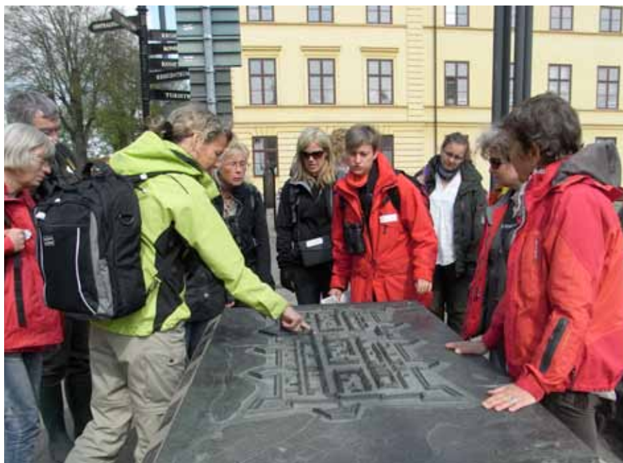
Lärofortbildning i Kristianstad.

Ledningen för Skoletjenesten och enheten Kulturutveckling Barn och Unga hade hela tiden mötts regelbundet för att diskutera verksamhetens inriktning. Vid ett möte i juni 2009 slog man fast att Skoletjenesten Öresund tills vidare skulle omdefinieras till ett mer konsultativt, utvecklande uppdrag . Den rollen hade vi redan haft i vissa ärenden, t ex när det gällde ett projekt mellan Teknisk Museum och Fredriksdals museum och trädgårdar inom ramen för Helsingborg – Helsingørsamarbetet.