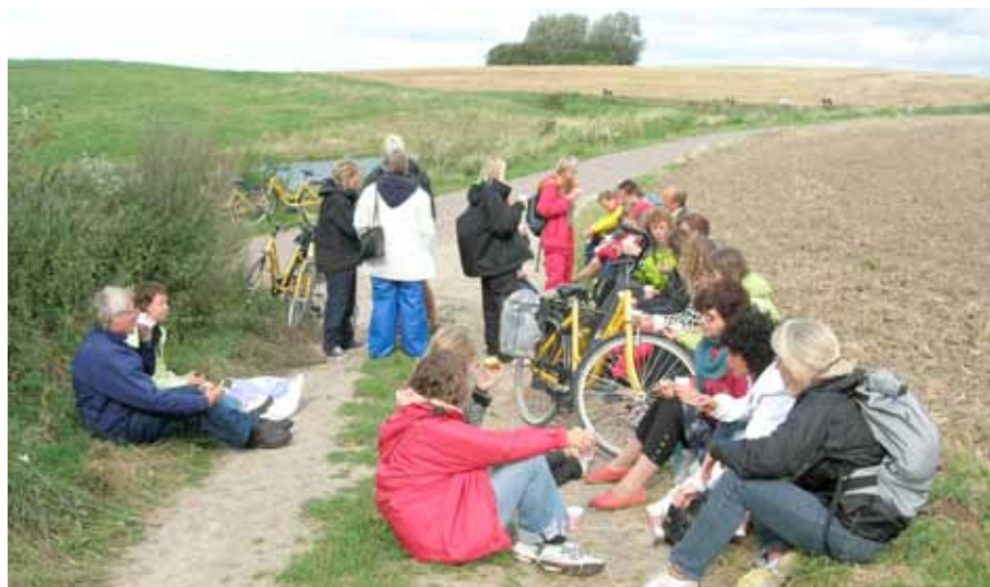
Kulturpedagogiskt nätverk i Skåne på seminarium på Ven.

hela tiden haft skolan som enda målgrupp och pedagogiken som huvudsakligt arbetsområde, medan kulturpedagogiken blivit en allt mindre del av Kultur Skånes växande uppdrag.