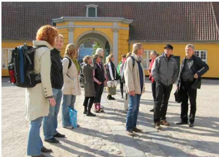
ÖKA-nätverket på uppföljning i Roskilde.

33 lärare deltog i denna vidareutbildning (utvalda av drygt 100 sökanden), som sträckt sig över skolåret 05-06. 17 kom från Skåne och 16 från Sjælland. Hälften arbetade i grundskolan och de andra framförallt i gymnasiet, men det fanns också några representanter från vuxenutbildning och lärarutbildning. Dessa lärare skulle sedan verka som ambassadörer på sina skolor och sprida sina kunskaper och erfarenheter vidare.