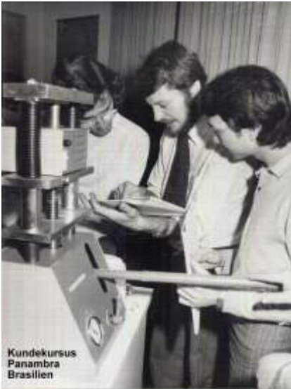
Undervisning af kunder i 1976