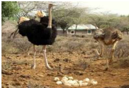
Vilde strudse bor i baghaven