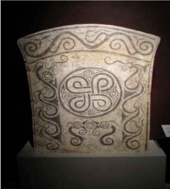
Billedsten fra Fornsalen, Visby