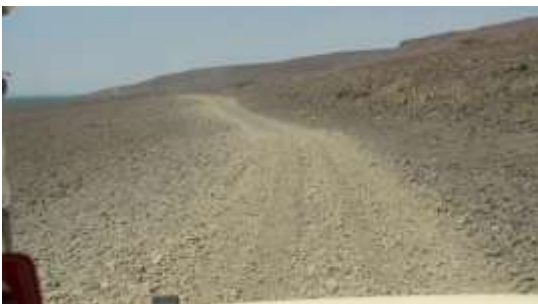
Vejen langs Turkana søen