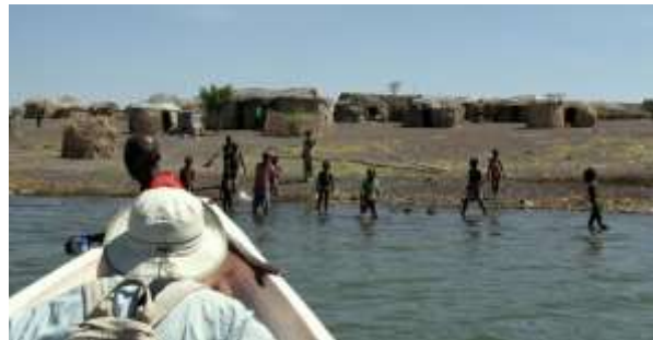
El Molo landsby