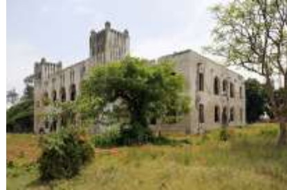
Tysk boma, Bagamoyo