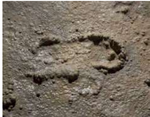
Et 10.000 år gammelt fodspor