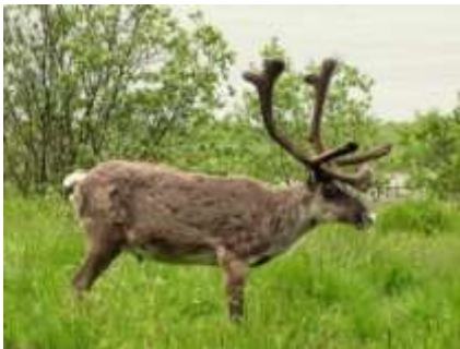
Rensdyret holder vagt

Der kan vises genstande med relation til præsentationen.