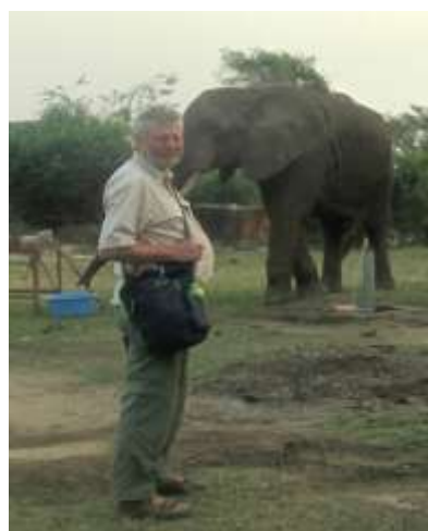
Elefanten åbnede selv for vandhanen