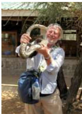
Det er kun en kvælerslange