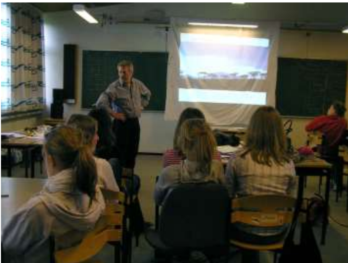
Gæstelærer på Syvstjerneskolen