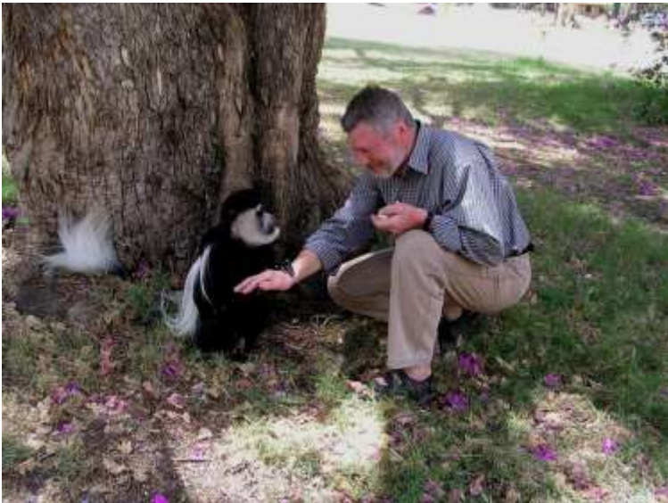
Silkehaleaben vil have brød