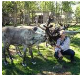
Kraffoder er fristende