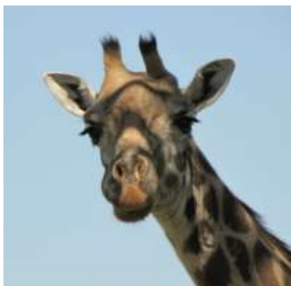
Giraffen holdt øje

Vores rejseform har betydet, at de vilde afrikanske dyr i vidt omfang er kommet til os. Det har givet anledning til nogle intense bavian-, vortesvin-, giraf- og elefantoplevelser. Bøflerne, flodhestene, nilkrokodillerne og løverne blev betragtet på behørig afstand.