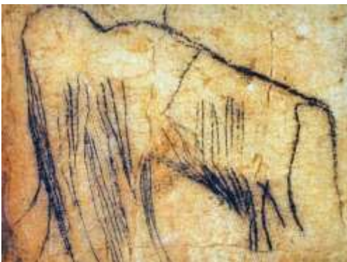
Mammut malet for 25.000 år siden