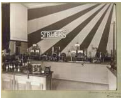
Tivoli udstilling 1930