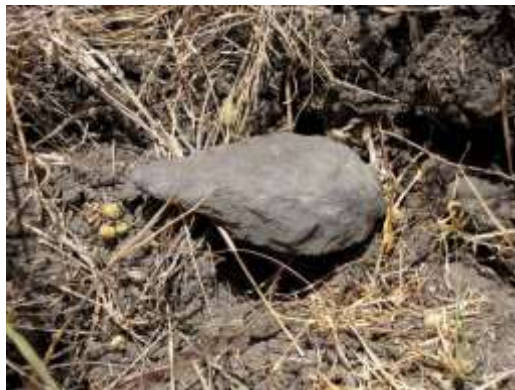
Håndkile. 800.000 år gammel