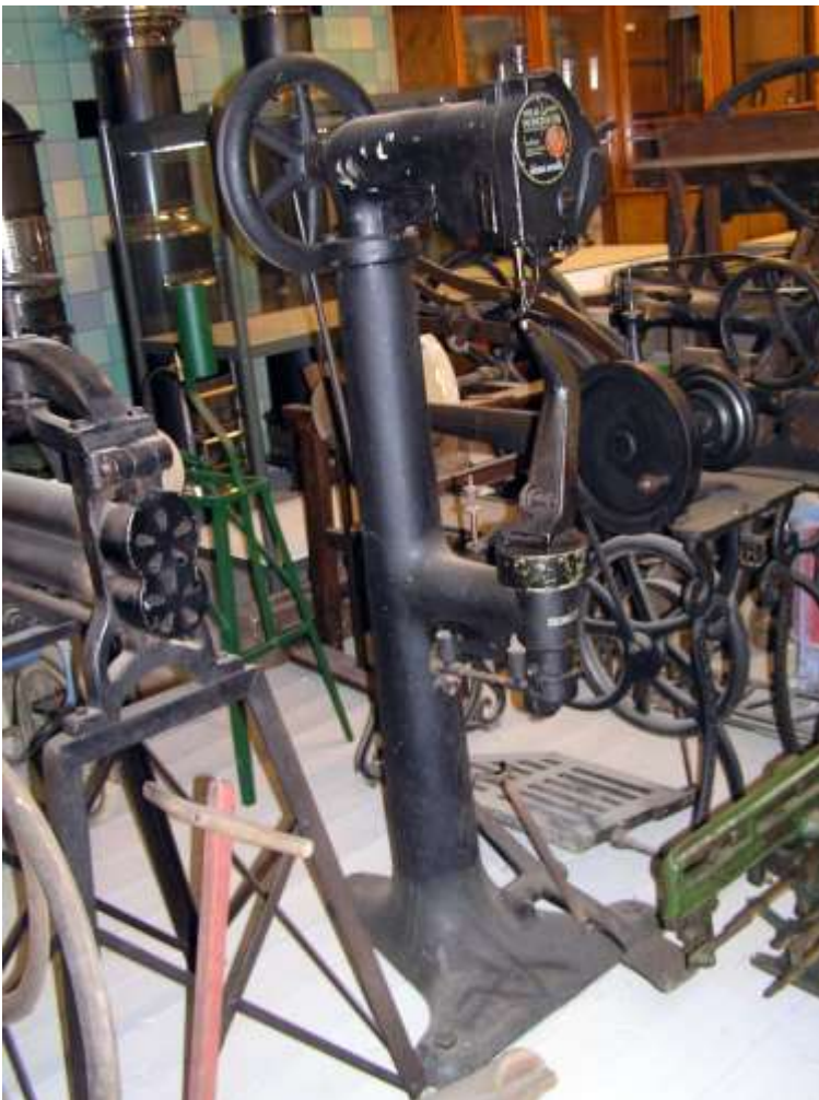
Fra Slagelse Museum