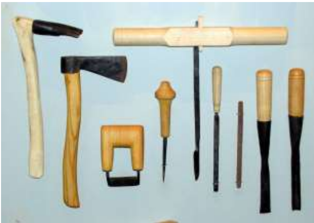
Hjemsted - jernalderkopier