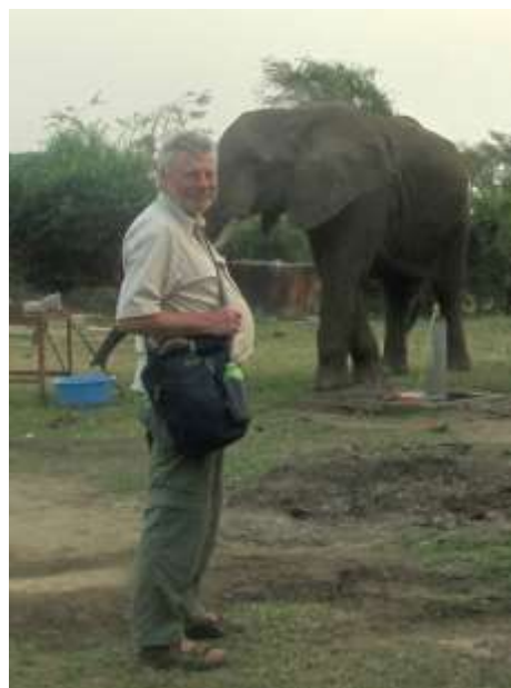
Den vilde afrikanske elefant var nysgerrig