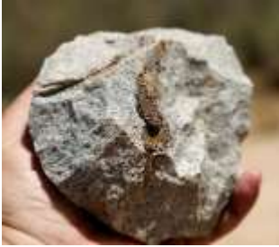
Kærne 300.000 år