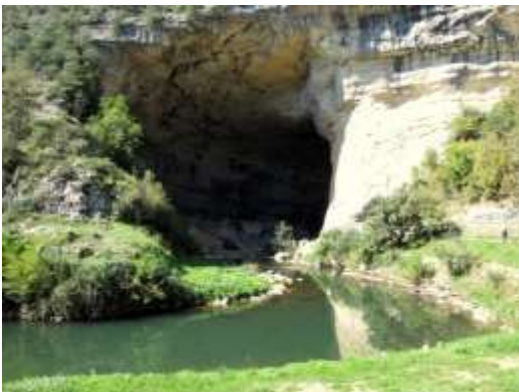
Huleindgangen er 70 m høj