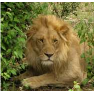
Hvad de store katte fandt på

Præsentationen understøttes af fremvisning af etnografiske, biologiske og geologiske genstande.