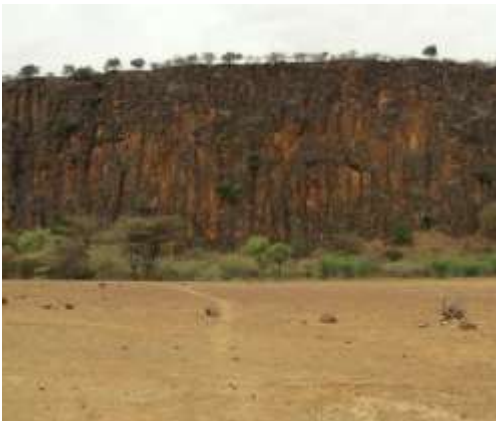
Vertikal forskydning i The Great Rift