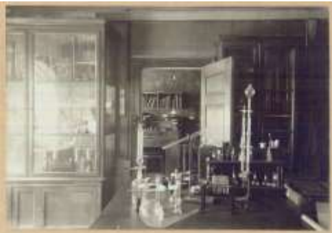
Holger Struers' chemiske Laboratorium