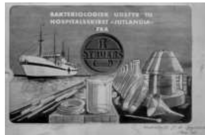
Annonce fra 1951