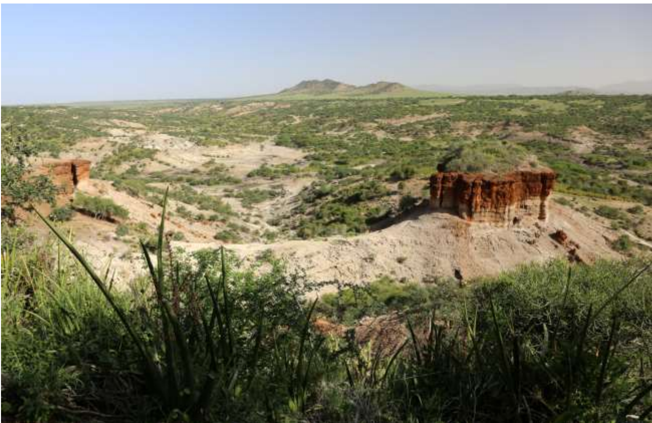
Oldupai Gorge med oldupai planter i forgrunden

Der fremvises en udviklingsrække for tidlige arkæologiske redskaber.