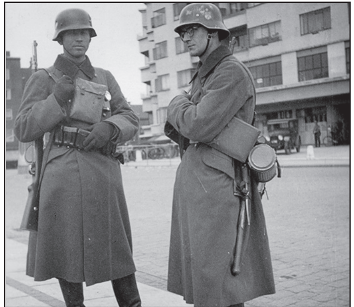
Tyske soldater i Nørresundby 9. april 1940.

6. Der var mange varer, der blev svære at skaffe. Hvordan fordelte man de varer der var til salg?