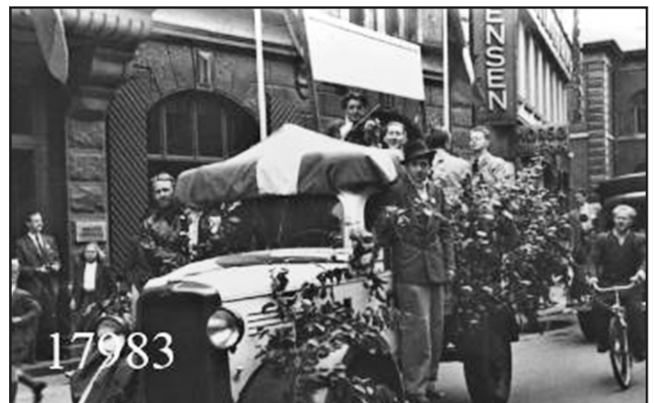
Optog på Nytorv i Aalborg maj 1945 i forbindelse med befrielsen.