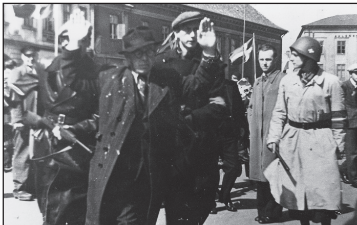
Optog på Nytorv i Aalborg maj 1945 i forbindelse med befrielsen.