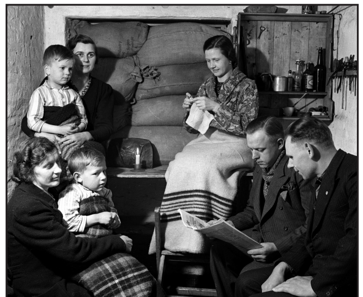
En lille gruppe danskere i beskyttelsesrum.