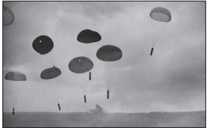
Våben kastes ned til danske modstandsgrupper.

Kl. 20.30 4. maj i en nyhedsudsendelse fra BBC kom budskabet om at de tyske tropper havde overgivet sig.