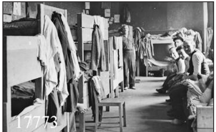
Optog på Nytorv i Aalborg maj 1945 i forbindelse med befrielsen.