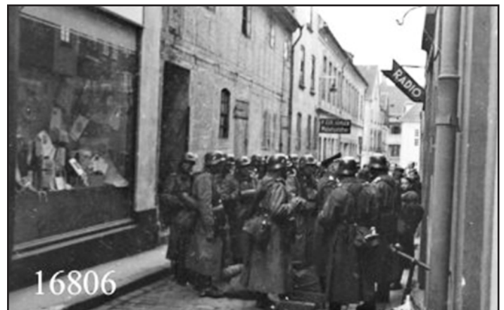
Tyske soldater 1940.