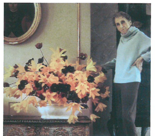
Karen Blixen ved en af sine smukke blomsterdekorationer fra haven ved Rungstedlund.

her ud. - som mig og sig væl hvad anders og b man ar kan ta 1874