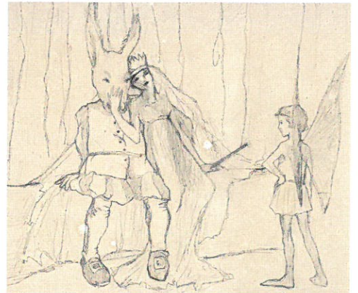
Karen Blixen Titania, Vindsel og en alf, akt III, scene 1 fra Shakespeares En Skærsommernatsdrøm . Blyant på papir. Det Kgl. Bibliotek..