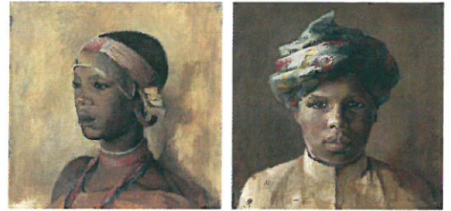
Collage. Eksempler på Blixens malerkunst. Karen Blixen Museet.