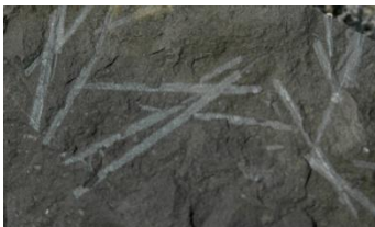
Aftryk i skiffer