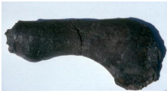
Knogle fra overarm