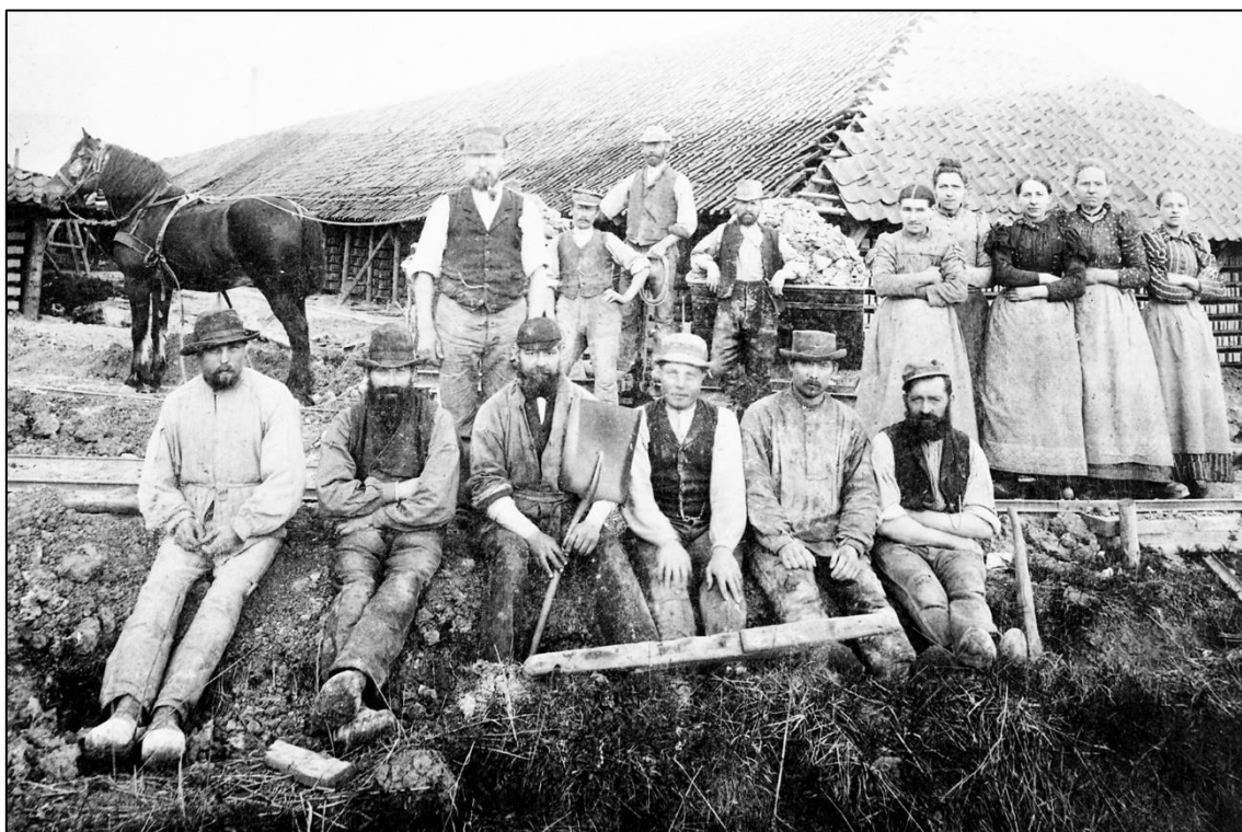
Arbejdsstyrken på Cathrinesminde 1890.

Fabriksloven fra 1867 blev ændret i 1878. Nu måtte ingen børn under 12 år arbejde på fabrik. Der skulle også ansættes en fabriksinspektør. Han skulle rejse rundt og undersøge arbejdsforholdene på fabrikkerne. I 1891 blev fabriksarbejdet for alle børn forbudt. Man blev betragtet som barn indtil man var blevet konfirmeret. Først derefter kunne man få arbejde på en fabrik eller et teglværk. De fleste børn blev konfirmeret når de var omkring 13-14 år gamle. Drengene gik som regel i skole ét år mere end pigerne.