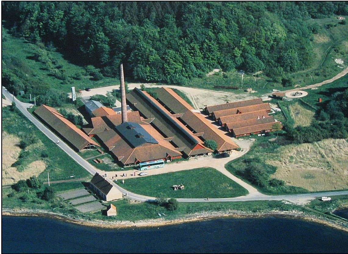
Cathrinesminde teglværk 2007.