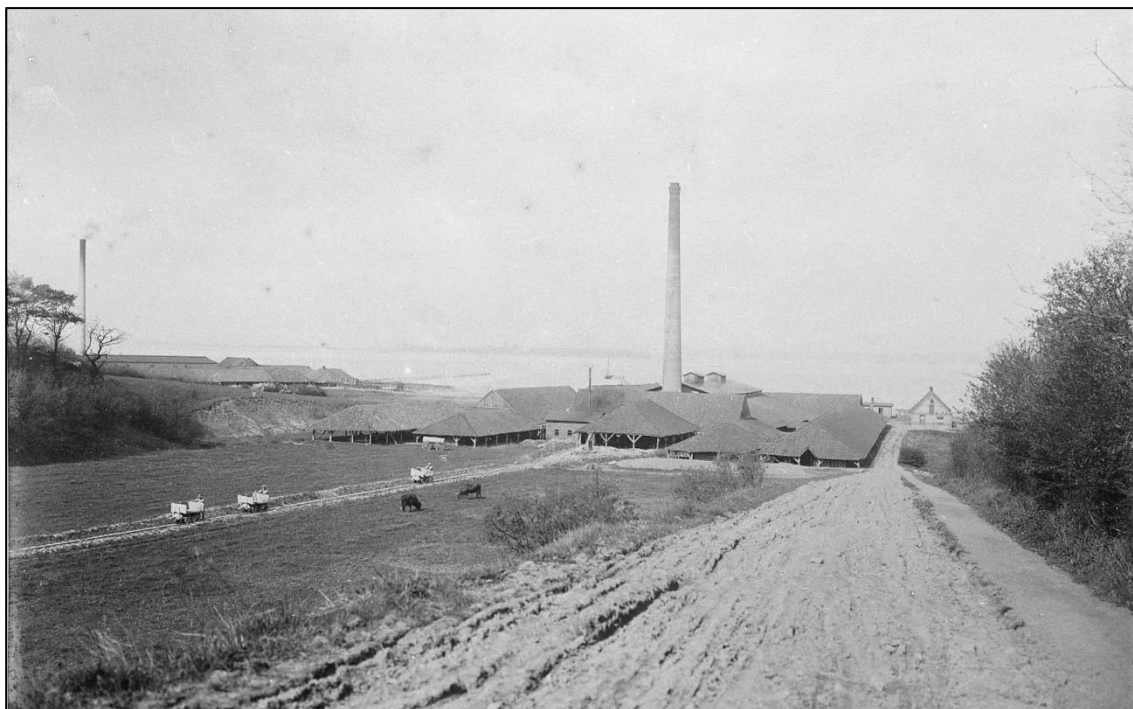
Cathrinesminde Teglværk 1900.