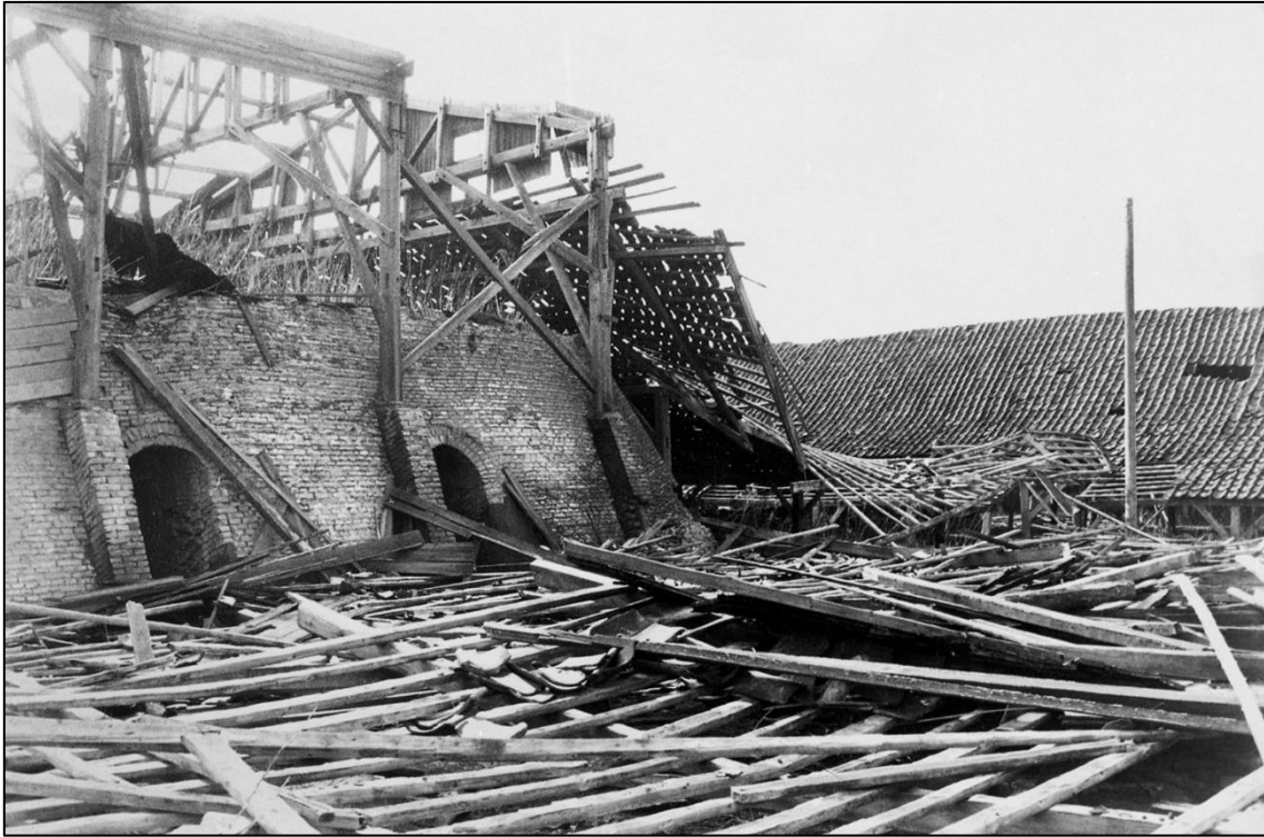
Cathrinesminde Teglværk 1987 - inden restaurering.

De mange teglværker der har været på Sundeved og Broagerland har tidligere givet beskæftigelse til mange mennesker. Ofte så man at det var hele familier der deltog i arbejdet, mænd, kvinder og børn. Familierne kunne enten bo direkte på teglværket eller lige i nærheden.