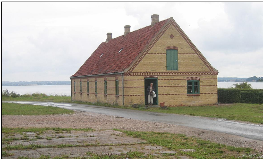
Arbejderboligen ved Cathrinesminde ca. 2007.

Sådan var det ikke på Cathrinesminde Teglværk, hvor man både havde en papkaserne til sæsonarbejderne og en arbejderbolig med 4 små lejligheder til de fastboende. Hver lejlighed havde 3 rum: køkken, soverum og stue, hvilket var ret godt. I 1920 blev huset bygget om til 3 lejligheder med hver 4 rum. Det fjerde rum blev enten brugt til aftægt for bedsteforældre eller som en fin stue. Senere blev et rum brugt til et kontor.