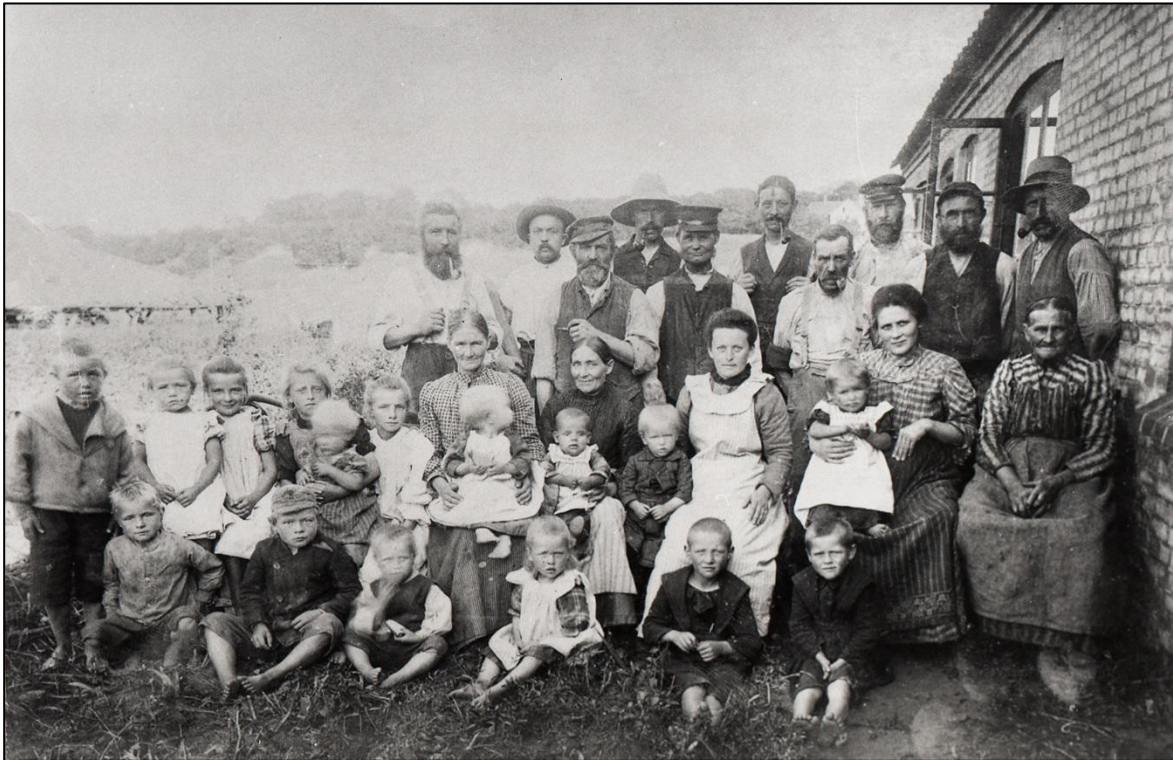
Arbejdsstyrken ved Cathrinesminde Teglværk 1914.