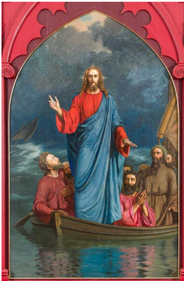
Billede af altertavle i Marstal Kirke