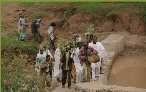
THE GREAT GREEN WALL