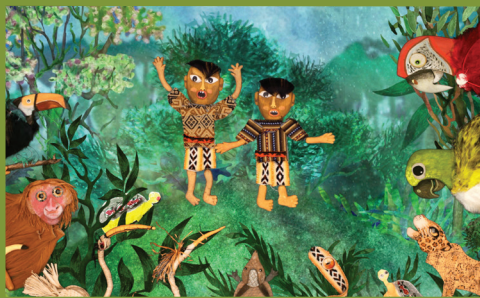
MYTER FRA AMAZONAS