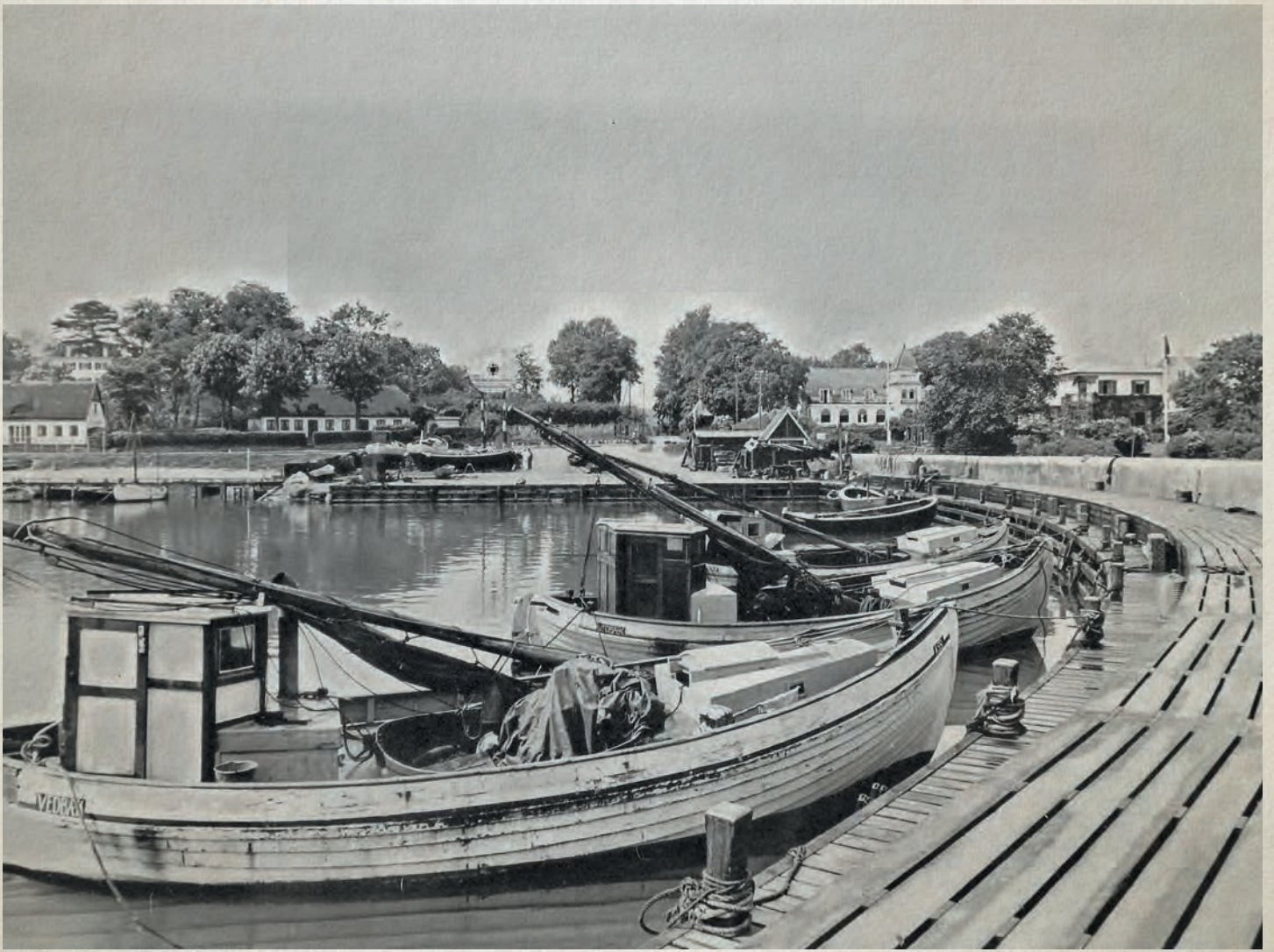
Fiskerbåde i Vedbæk havn i 1943