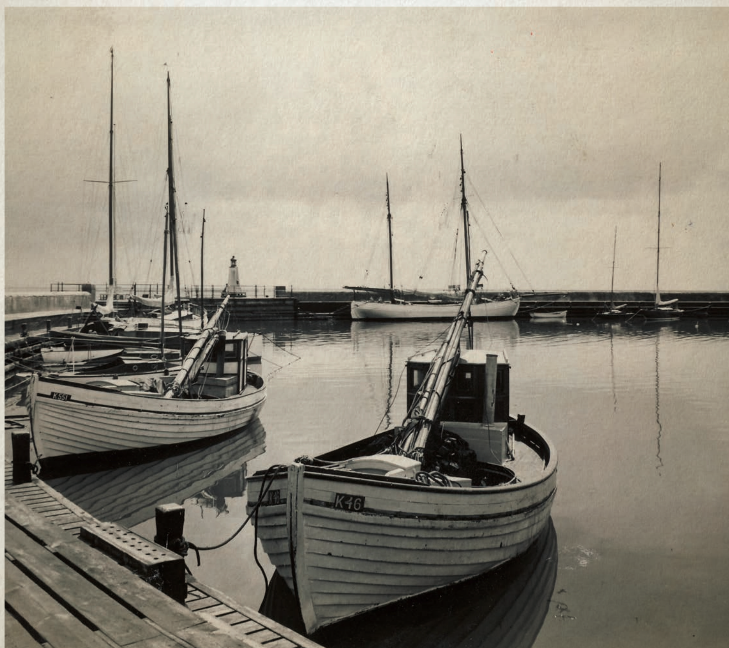
Fiskerbåde i Vedbæk Havn 1940