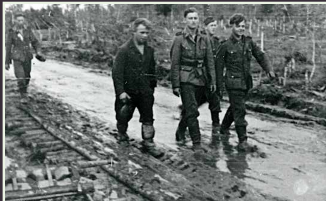
Formentlig Frikorps Danmark ved fronten. De plørede veje var et stort problem.

knækkede 8 pansere og hentede 10 slagflyvere ned, foruden at 'Ivan' efterlod i hundredvis af talte døde foran os (...) Forplejningen er p.t. helt ovenud, da vi jo til dels også 'lever af landet'. Den daglige kost er hønsekødssuppe, gåse-, ande- eller flæskesteg osv. Vejret er desværre dårligt. Regntiden er sat ind og pløret tiltager dagligt (...) Her går alt for så vidt godt. Hilsen Per"