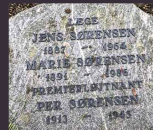
Per Sørensens gravsted i Løkken, 2022.

1968: Pers lig bliver gravet op og kremeres. Urnen bliver nedsat på familiens gravsted i Løkken.