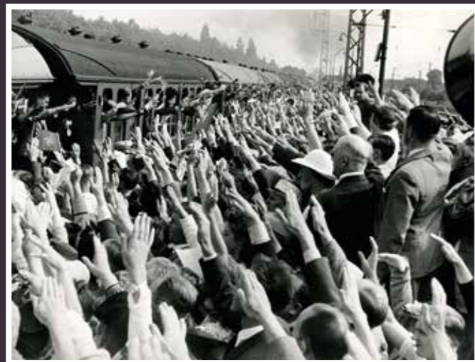
Den første bataljon af Frikorps Danmark afrejser fra Hellerup Station 19. juli 1941. Læg mærke til menneskerne på perronen. Hvad gør de med hænderne?