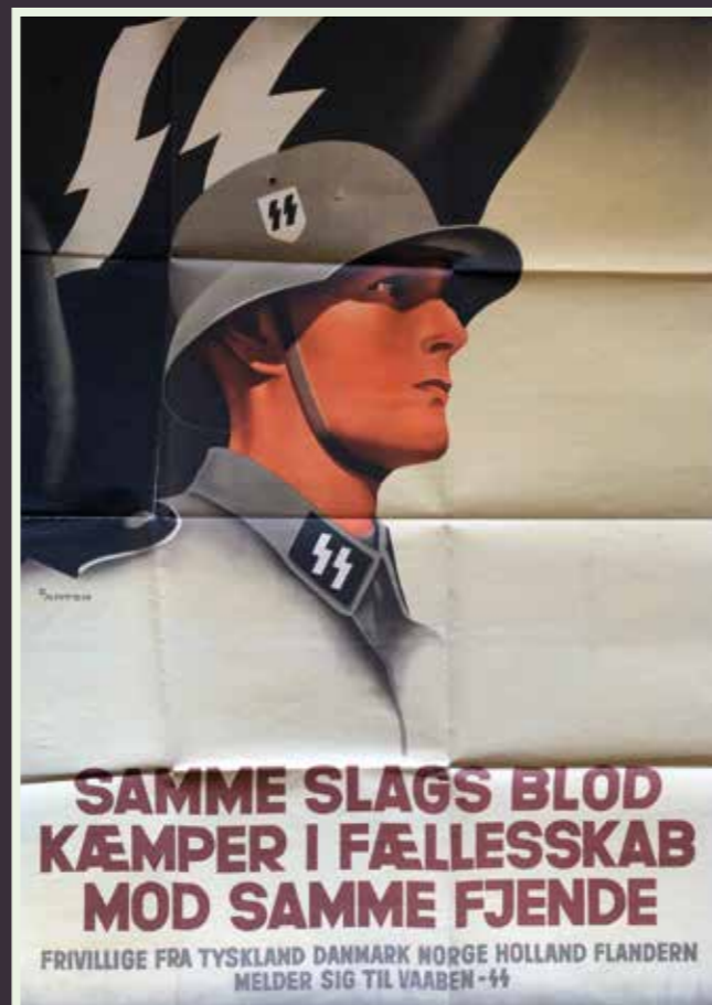
Hverveplakat for at få folk til at melde sig til Frikorps Danmark. Plakat: Rigsarkivet.