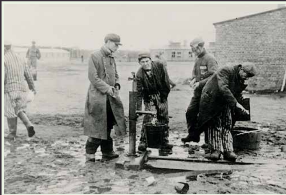
Koncentrationslejren Dachau.

anden. Det var en stor oplevelse at se. I ved jo hvad man i Danmark mest hører om K.Z.-lejre. Det er ligesom alt andet løgn fra ende til anden. I gør jer ingen forestilling om den fantastiske orden og renlighed, som hersker dér – og om det arbejde, der præsteres."