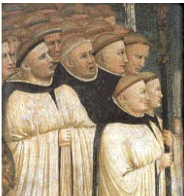
Munke i bøn.

Novicerne levede efter de samme regler i klostret som munkene. Læs om deres hverdag under Munken.